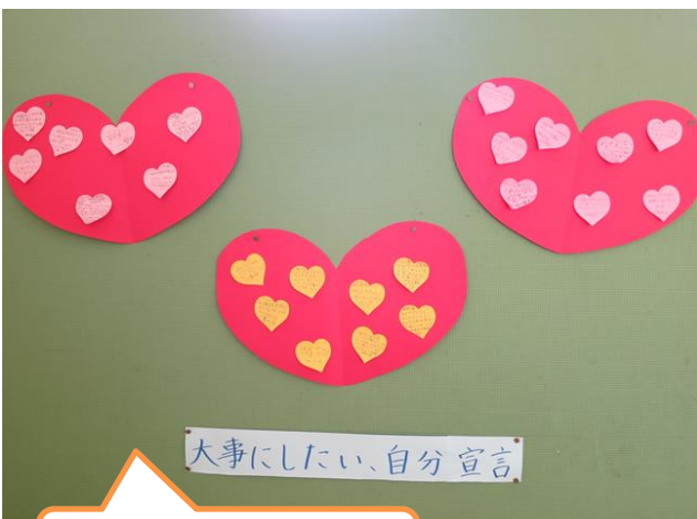
大事にしたい自分宣言