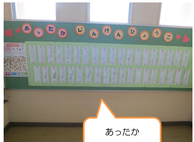
あったか 人権標語