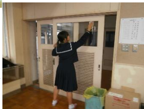
下：美化委員会が企画した清掃ボランティアの様子