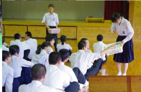
上：文化委員会企画の牛乳パックたたみ方についての集会の様子

これまで委員会の活動をあまり紹介していませんでしたので、活動の一部を紹介します。12月24日午後には保健委員会が企画・運営を行う校内球技大会もあります。3年生生徒会事務局、各専門委員会委員長・副委員長の皆さん、あと半月、引き続きよろしくをお願いします。