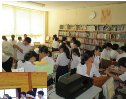
上：図書委員会主催の図書館祭りの様子

写真はありませんが、総務委員会では髪型についてのアンケート、ノーチャイムデーなどを実施しました。放送委員会では、給食時に生徒のリクエストによる音楽を流したり、様々なアナウンスをしたりしたほか、行事での放送機器の準備なども行いました。