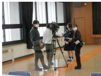
報道各社からの取材

日本と韓国の真の友好関係を築くためには、竹島問題の平和的な解決が必要であり、我が国が正当に主張している「竹島が歴史的事実に照らしても、かつ国際法上も明らかに我が国固有の領土である」という立場に基づいての教育を島根県では行っています。