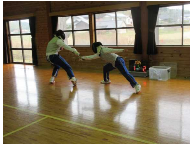
フェンシング巡回指導(1/18)