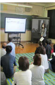
左上：公開授業 3年学活 左：1年学級懇談 上：PTA総会 右：入試制度説明

授業公開の後は、今年度の安来二中の取組について説明を行いました。今年度の学校経営方針について特に保護者の皆様にお伝えしたいこととお話ししました。