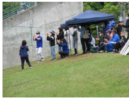
市総体で野球を応援して下さる保護者の皆様

感染拡大のリスクを下げるため、今年度も評議員等は書面議決となりました。学校として、皆様に直接お礼申しあげることができず、申し訳ありません。子どもたちのために、お力添えをどうかよろしくお願いいたします。