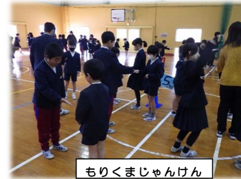
もりくまじゃんけん