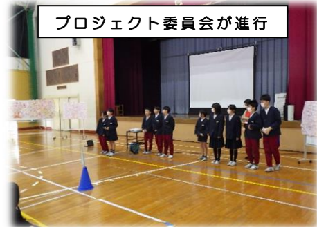
プロジェクト委員会が進行