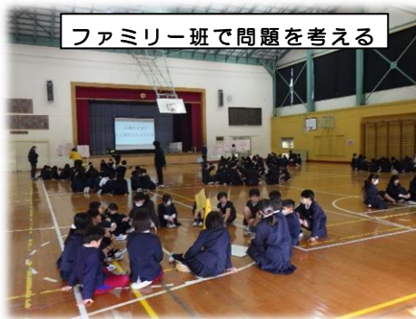
ファミリー班で問題を考える