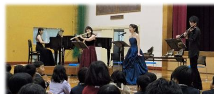
「プチショコラ」さんによる音楽鑑賞会 令和5年12月12日

荒島小学校では、今でも芸術鑑賞や音楽鑑賞を大切にしています。今年度行った「プチショコラ」さんによる音楽鑑賞会もふるさと安来、ふるさと島根を愛する心を十分に育んでくださいました。