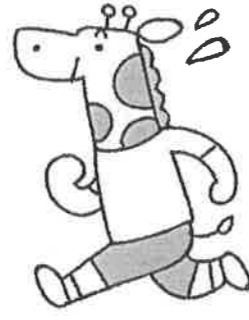
運動で体をうごかそう