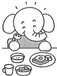
しっかり朝食を食べよう