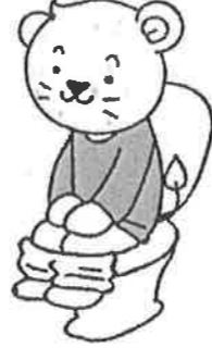
決まった時間に排便