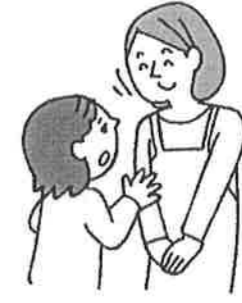
悩みや心配があるとき