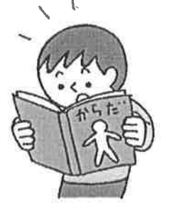
体について学びたいとき