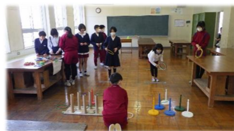
6年生の出店「輪投げ」

下学年から6年生へ、そして6年生から下学年へ、 感謝の輪 が全校へ広がった荒島小学校です。