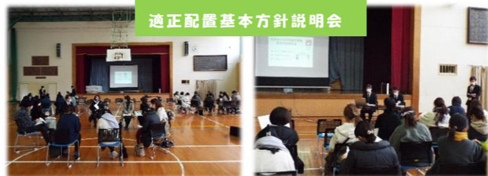
適正配置基本方針説明会