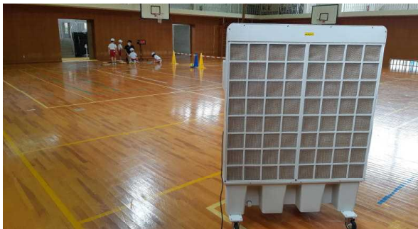
☆大型冷風扇です。 すでに夏場の体育の時間にも使いました。 災害時などにも活用できます。

今回の50周年記念事業にあわせ、「大型冷風扇 2台」のご寄贈をいただきました。また、小学校の前庭「友情の庭」の防草整備も進めていただきました。紹介にあわせお礼申し上げます。本当にありがとうございました。