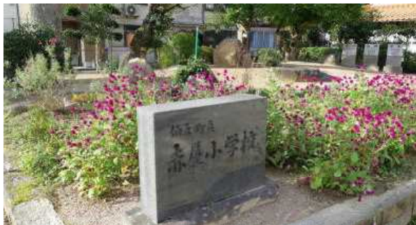
☆友情の庭の様子です。 防草処理を施した土で固めてあります。 赤屋小の石碑も移設しました。