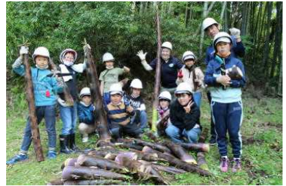
☆森林教室（3～6年）の様子