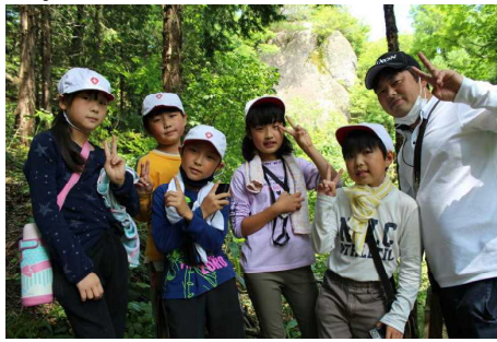
☆写真・右 稚児岩とご対面。 みんなで記念撮影です。