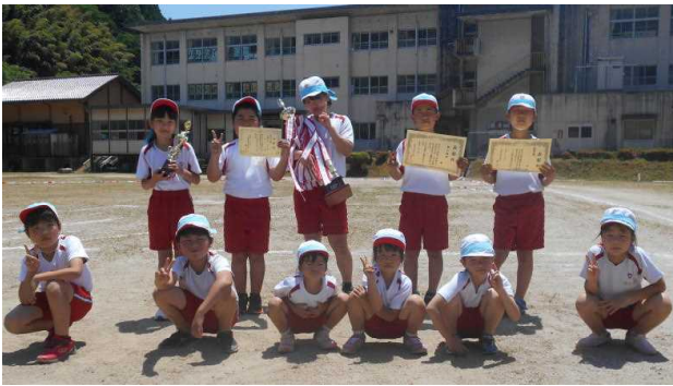
☆総合優勝 青組 応援の部「優勝がしゅくめいで賞」

午前中のみ、またご家族のみの参加で、地域の皆さまにはさみしい思いをされた方もおられたのではと思いますが、心に残る運動会となりましたこと、ご報告させていただきます。また保護者の皆さまには朝早くからの準備、競技の参加や応援など大変お世話になりました。ありがとうございました。