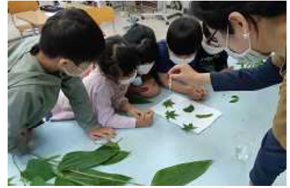
☆森林教室（1・2年）の様子

今回の受賞は、たくさんの赤屋小学校の卒業生の皆さま、保護者や地域の皆さま、そして今までご勤務された教職員の皆さま、すべての皆さまの長年にわたる取組が評価されたものです。この度、赤屋小学校の代表として式典・懇談に出席させていただきましたが、赤屋小学校の取組、また赤屋の地域の魅力が少しでもお伝えできたのではと思います。報告にあわせ、このような貴重な機会をいただけたこと、皆さまに感謝申し上げます。ありがとうございました。