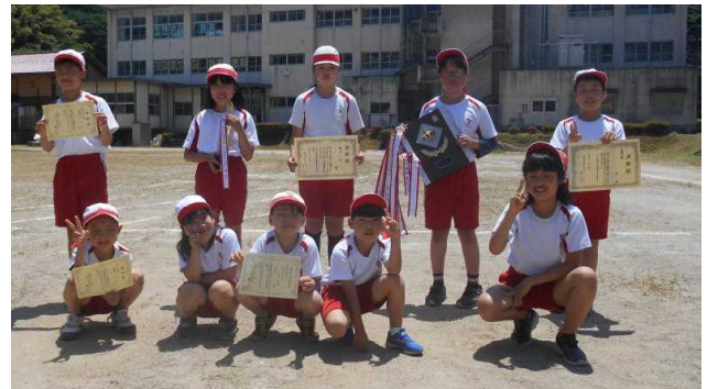
☆総合2位 赤組 応援の部「おかわりいっぱい賞」