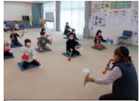
ふるさとクラブの活動の様子