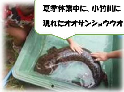
夏季休業中に、小竹川に現れたオオサンショウウオ

朝晩はずいぶん と涼しく、過ごし やすくなりました 。今年の夏も暑 く、また、いつも と違い、新型コロナ ウィルス感染症対 策のため、自粛が続いた夏休みだったのではないで しょうか。その中でできることをそれぞれに考えられ、大きな事故やけがもなく元気に過ごせたことを大変うれしく思いました。夏休み中は地域や家庭で、様々な面から子どもたちを支えていただきましたこと、心からお礼申しあげます。