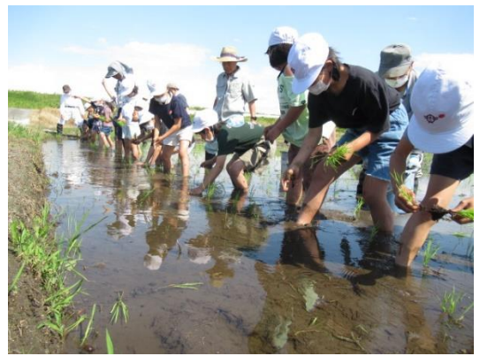
地域の皆様にお世話になり、学校近くの田んぼで3年生が田植えをさせていただきました。