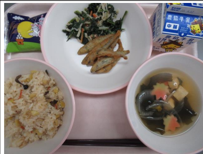
9月7日《お月見献立》栗ときのこの炊き込みご飯、 牛乳、月見大福、きびなごのネギ揚げ、切り干し大根 の和え物、もみじ麩のすまし汁