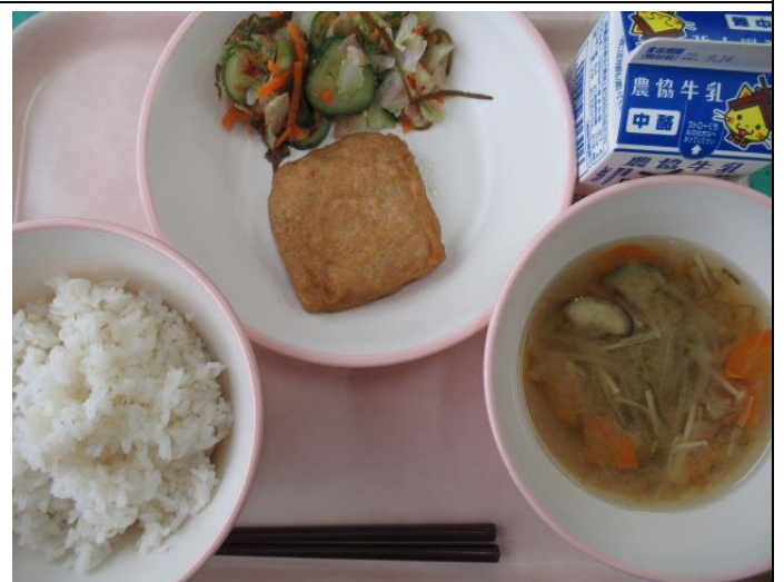
9月8日 麦ご飯、牛乳、肉信田煮、めかぶ和え、 えのきの味噌汁