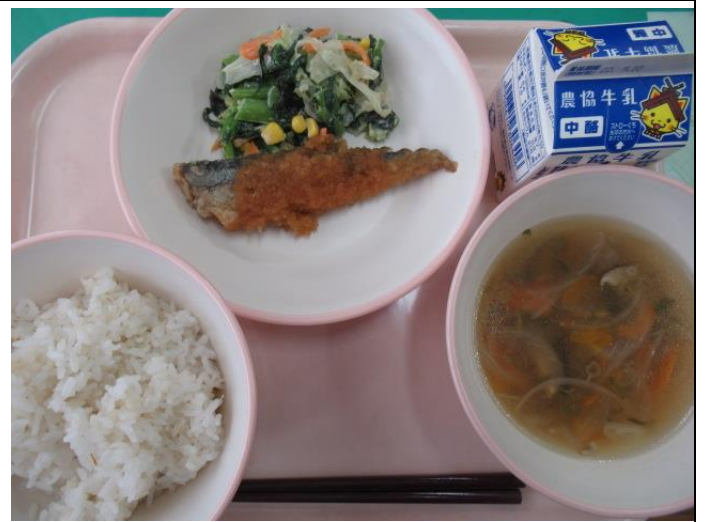
9月5日 麦ご飯、牛乳、サンマのおろしかけ、 小松菜のサラダ、吉野汁