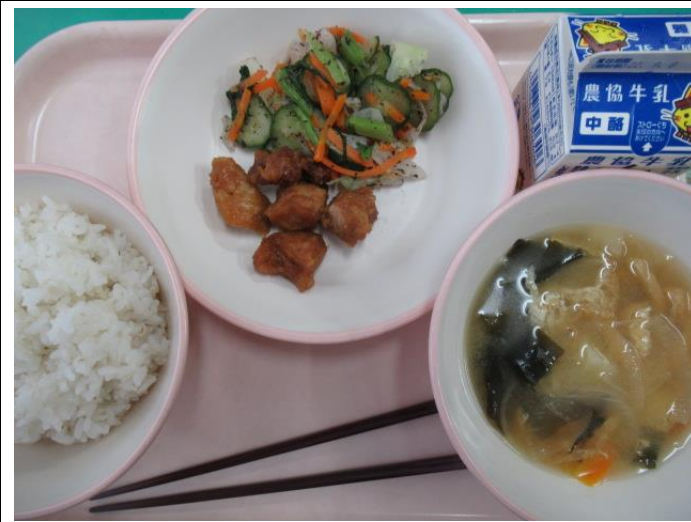
9月2日 麦ご飯、牛乳、豚肉のスタミナ揚げ、ゆかり和え 油揚げの味噌汁