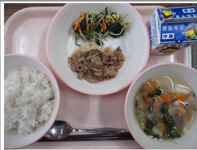
8月31日 焼き肉丼、牛乳、ナムル、ワンタンスープ