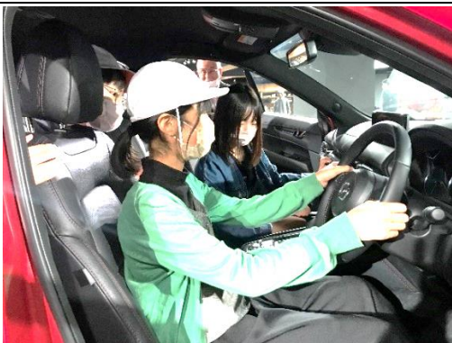
マツダ自動車工場を見学しました。