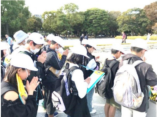
平和学習のため、平和公園を訪れ学びました。

修学旅行は、コロナ禍もあり最近の2年間は島根県内で行っていましたが、今年度は、広島方面で実施しました。6年生がとても熱心に学んでいて感心しました。