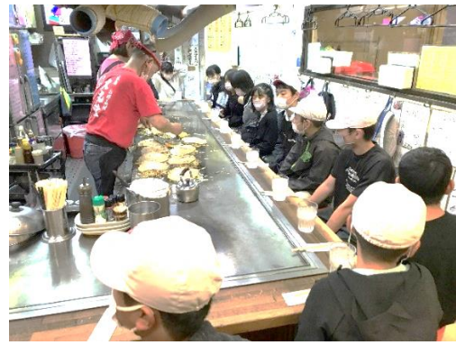
「お好み村」でお好み焼きを食べました。