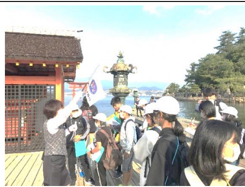
世界遺産の宮島に行きました。