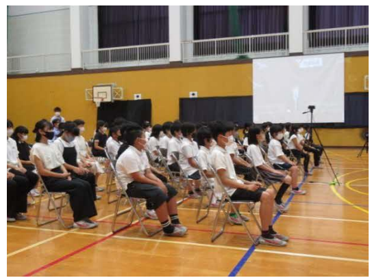
児童交流旗の掲揚で式が始まりました。6年生が児童代表として参加しました。