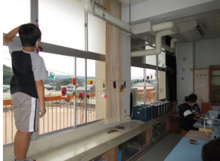
自分たちがつくったものを利用して、学校を自分たちのお気に入りに変えました。(6年2組の様子)