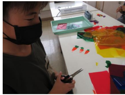
セロファンを好きな形に切ったり重ねたりして、お気に入りを見つけ絵にしました。(6年1組の様子)