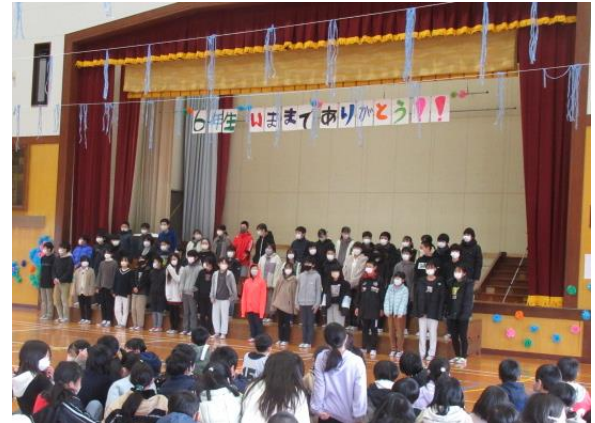
飾り付けられた体育館に、6年生が入場してきました。