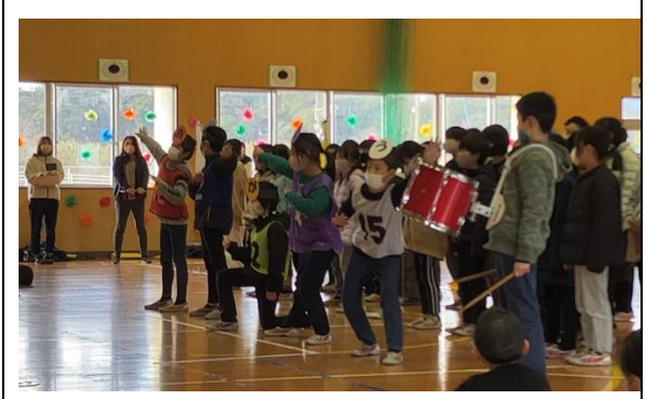
3年生は大うけの劇。4年生は感謝のエールを贈りました。