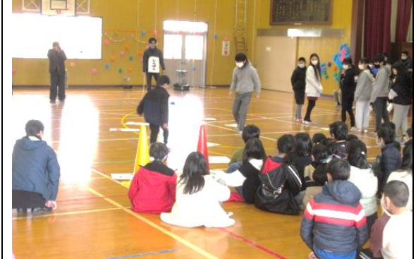
2年生は素敵なプレゼント。1年生はかるた勝負！