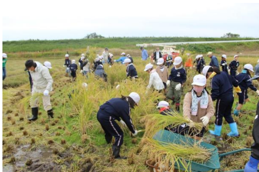
3年生が植えた稲が大きく育ち、10月25日に稲刈りをさせていただきました。