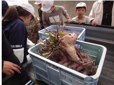
あすなろ・たんぼぼ学級も芋掘りをさせていただきました。(10月22日)