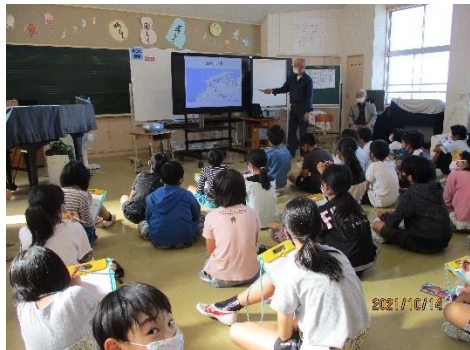
4年生は、飯梨川のお話を聞かせていただきました。(10月14日)