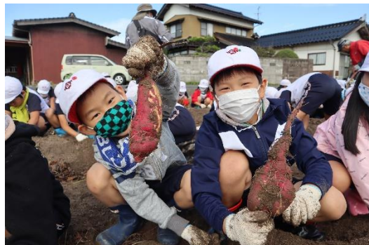
1, 2年生は、さつまいも掘りを体験させていただきました。(10月19日)