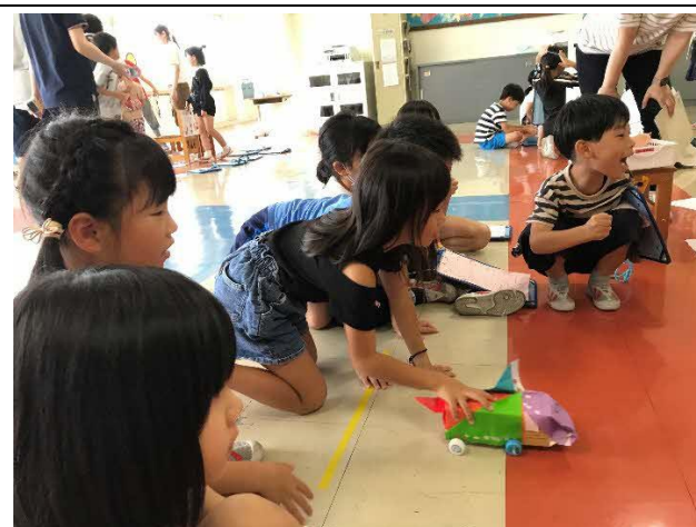
2年生が生活科でおもちゃランドを作り1年生を招待しました。1年生も2年生も楽しそうでした。