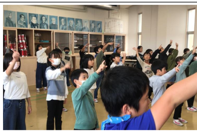
音楽会の練習をがんばっています。音楽会は、10月26日にアルテピアで開催されます。(4年)