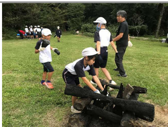
大山青年の家での宿泊体験学習。キャンプファイヤーの準備をしているところです。(5年)