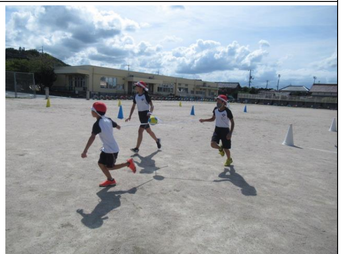
運動会の種目練習も始まっています。これは「3, 6年種目」の練習です。