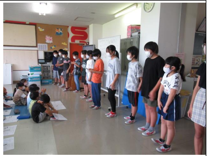
色別活動が始まり、6年生を中心に練習が進んでいます。5年生もサブリーダーとしてサポートしています。