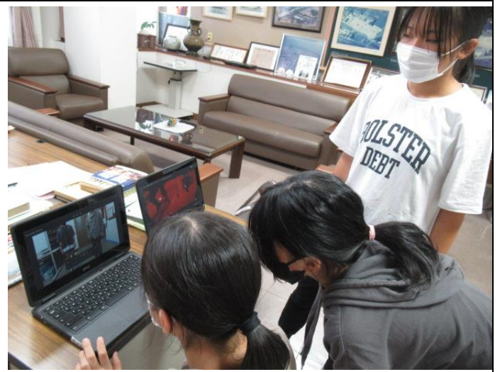
6年生は、色別活動がスムーズに進むよう、話し合っ準備をしています。