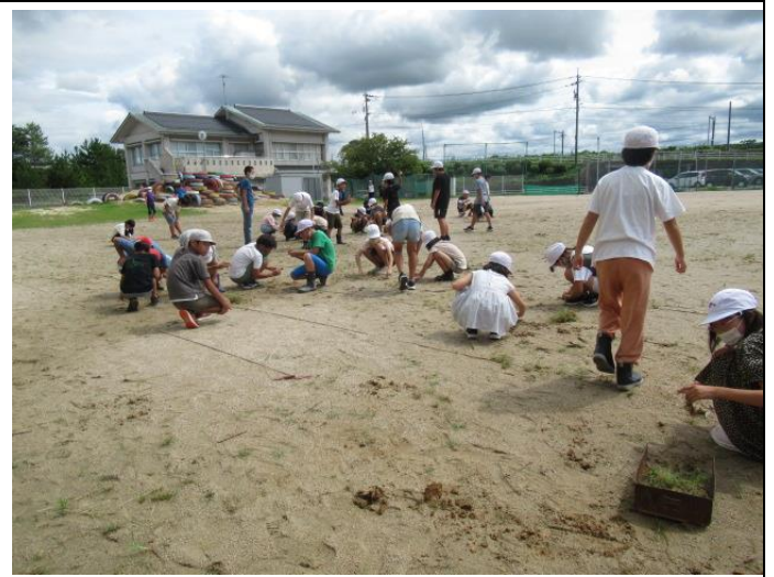
運動会に向けて代表委員会が開かれ、運動会について話し合いました。毎週木曜日のクリーンタイムで校庭をきれいにしています。