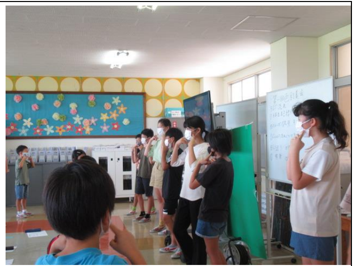
どの組も団結して練習を進めています。6年生がリーダーとして良くやっています。