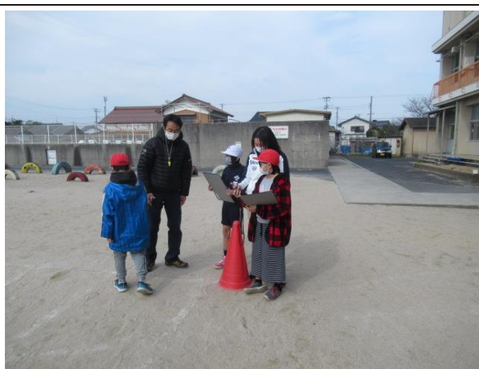
4年生は、50m走をしました。