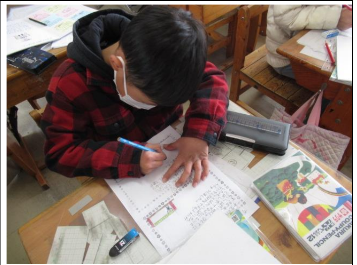
2年生は、生活科で「わたしのえほんづくり」に取り組んでいます。