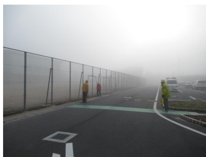
今朝は、霧が濃かったです。びっくり！