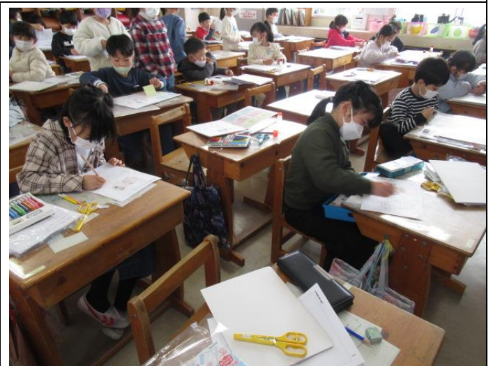
3年生は、図工で「玉転がしゲーム」を制作中です。