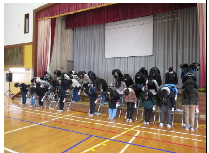
今日も6年生は、卒業式の練習です。当日はばっちりだと思います。