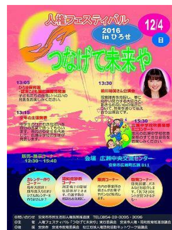
「人権フェスティバル」チラシ