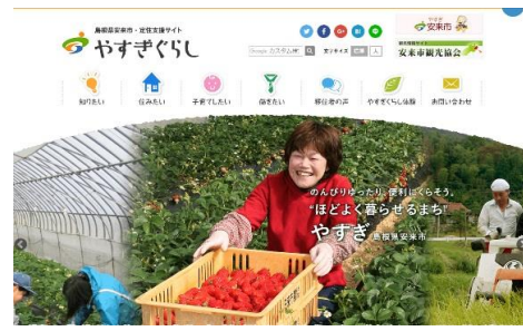
安来市定住支援サイト「やすぎぐらし」