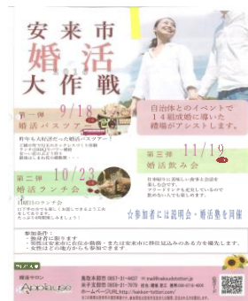
安来市婚活イベント