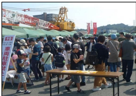
山陰いいものマルシェ（安来港）