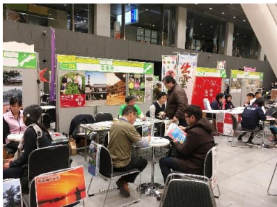
UIターンフェアの様子（東京会場）

昨年度開設した定住サポートセンターにおいて、住まい、仕事、生活などの情報を一元的に収集、提供し定住相談から支援、アフターフォローまでワンストップで行った。併せて、情報発信のツールとして安来市定住支援サイト「やすぎぐらし」を作成した。また、県外での各種定住フェアにおいて情報発信と相談業務を行った。