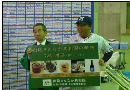
真中監督の圏域PR大使任命