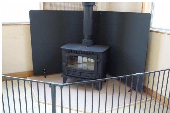
薪ストーブ（山佐交流センター）

薪ストーブを導入することで、地域内で薪を調達する仕組みづくりや薪割体験などによる異世代間交流、ストーブの炎を囲んでの交流など、様々な事業展開が考えられ、地域づくりにつながった。