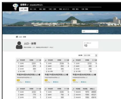
オープンデータカタログサイト