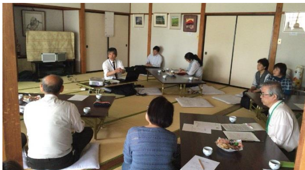
指導講師による人権学習会