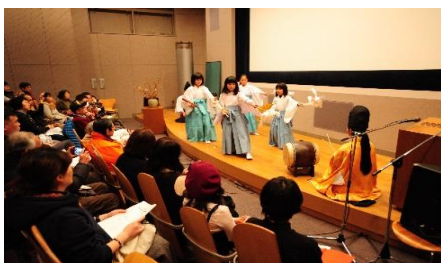
米（大国主大神）から鉄（金屋子神）へ伝承事業

地域の活力ある集落・地域づくりを進めるため、地域元気いきいき補助金を交付し、地域の活性化を支援(12件)した。（補助率：対象経費の2/3以内 上限：20万円）