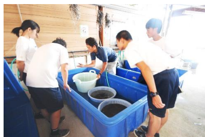
ふるさと教育（やすぎどじょうセンター）

安来市の情報発信力の向上と、高校生ふるさと教育、電子商取引のノウハウの学習を目的に、島根県立情報科学高校と協同で、安来市ふるさと寄付のPR及び返礼品掲載ページの作成を楽天株式会社の協力のもと行った。