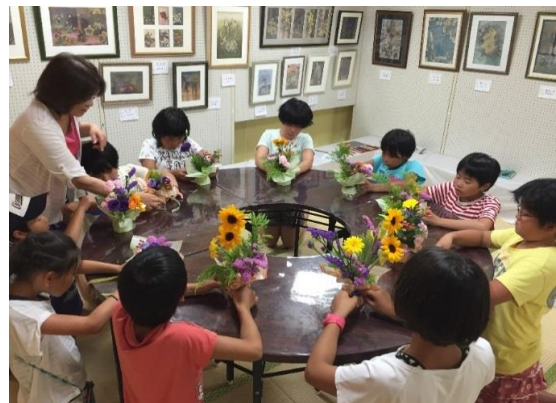
子育てふれあい教室（子ども生け花教室）