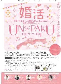
圏域合同婚活イベント

中海・宍道湖・大山圏域の12自治体合同婚活イベントを9月に2回開催し、2会場で178名の参加があり22組のカップルが誕生した。また、市単独で婚活イベントを3回開催し、延べ95名の参加があり計20組のカップル誕生となった。