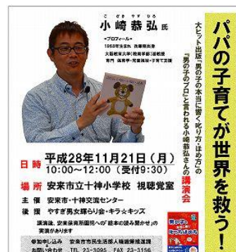
男女共同参画講演会チラシ