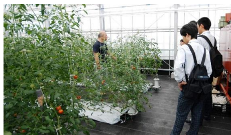
ふるさと教育（株式会社小林電気）