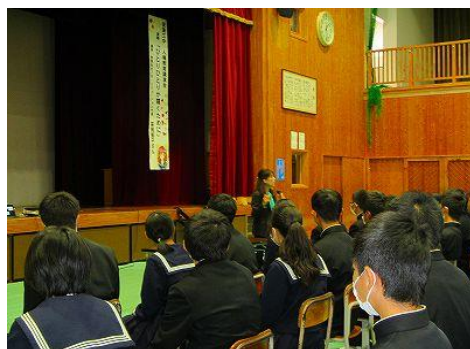
人権・同和教育研修会（安来第三中学校）