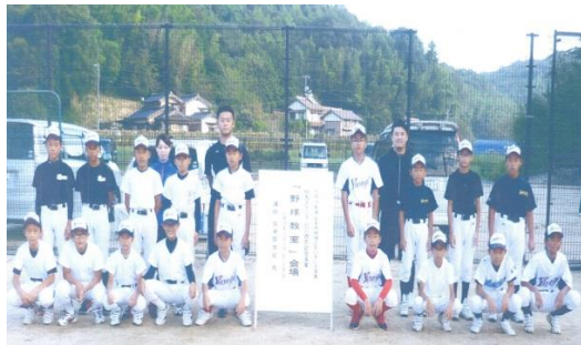
伯太スタジアム30周年記念事業 野球教室