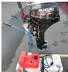
船外機 (安来) 381,240円×1機=381,240円