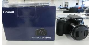
デジタルカメラ (安来) 63,169円×1台=63,169円