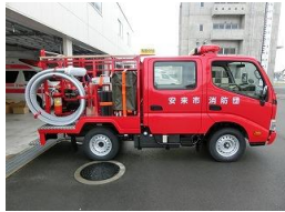
小型動力ポンプ付積載車（布部2班）