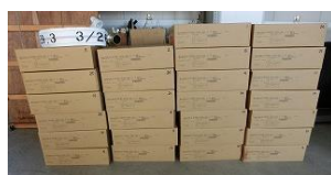
消防用ホース(各班配布26本) 34,560円×26本=898,560円