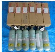
空気ポンペ 130,140円×6本=780,840円