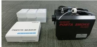
スモークマシン (安来) 237,168円×1式=237,168円