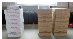
消防用ホース(県操法大会用21本) 34,560円×21本=725,760円