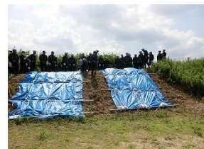
水防訓練（土のう積み、シート張工法）