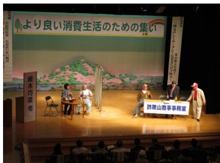
悪質商法防止の啓発劇