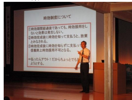
弁護士の啓発講演