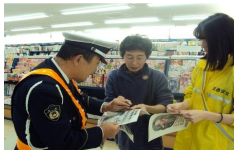
交通死亡事故多発警報発令時啓発活動 (フーズマーケットホックプラーナ店)