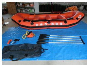
救命ボート一式（安来）