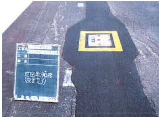
広瀬町上山佐常願寺