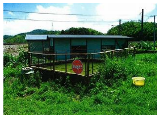
島田防火水槽柵修理