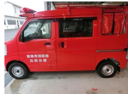
小型動力ポンプ付軽積載車（比田3班）