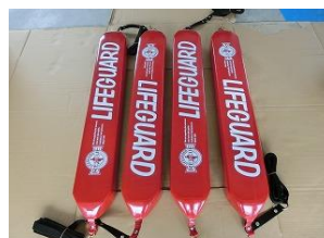
ライフガードチューブ4本