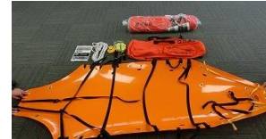
スケッドストレッチャー 140,400円×2式=280,800円 (広瀬、伯太)