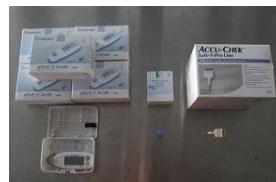
血糖値測定器一式 32,400円×5式=162,000 (安来2、広瀬、比田、伯太)