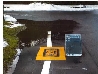
広瀬町下山佐福頼