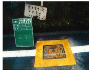
広瀬町上山佐本郷上口