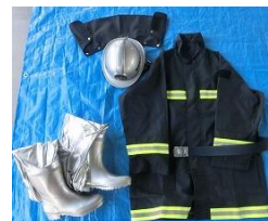
消防団員用防火衣 53,946円×60着=3,236,760円