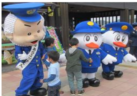
春の交通安全運動 安来・米子合同 交通安全街頭広報