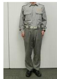
救助服・活動服・救急服