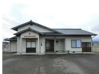
安来南消防団拠点施設（元大塚駐在所）