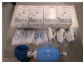
蘇生バッグ 30,240円×4個=120,960 (安来、広瀬、比田、伯太)