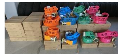
消防用ホース (51本) 42,120×20本=842,400 31,320×5本=156,600 41,040×26本=1,067,040